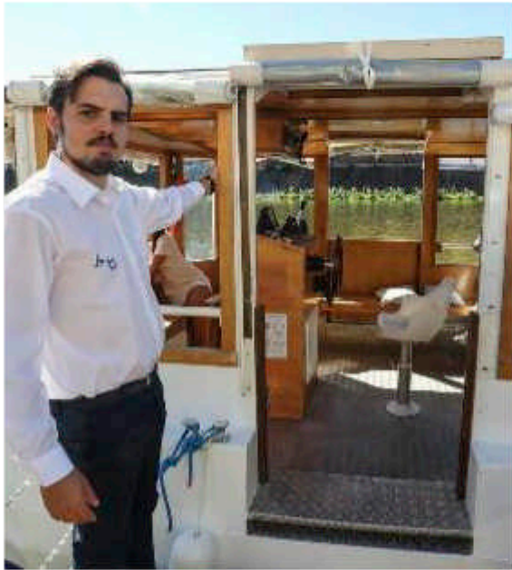
L'ingresso del battello

«Questo progetto nasce da lontano, quando, studente all'Università di Parigi, ho vissuto la grande tradizione di navigazione fluviale dei francesi. Sognavo di realizzarlo a Firenze, nella mia amata città perché non desi-